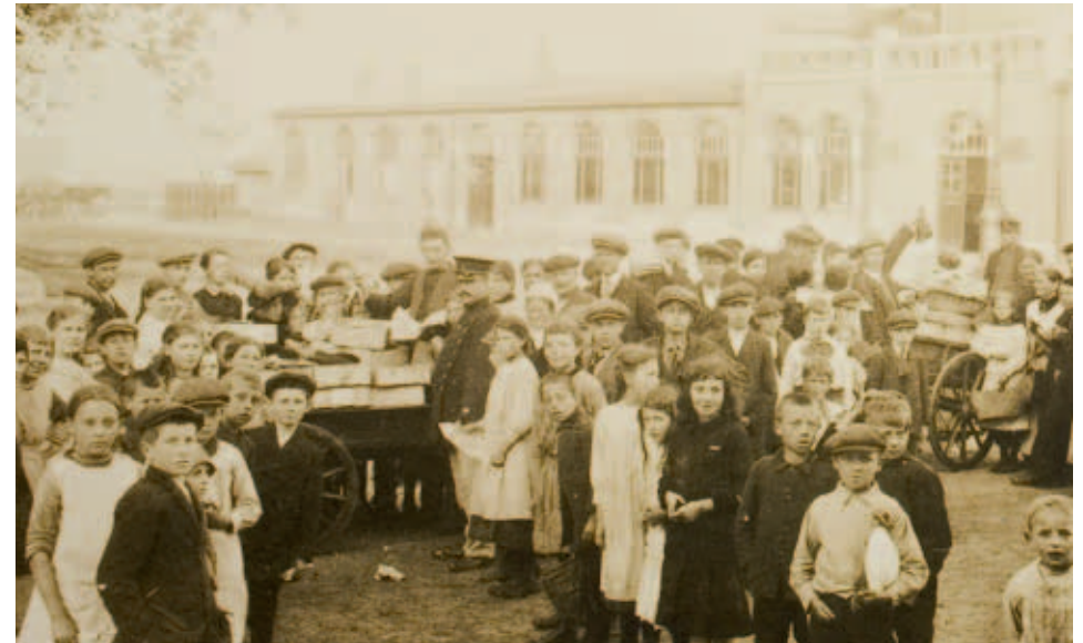
Het Stationsplein met het oude stationsgebouw. Op het plein heeft zich een menigte verzameld voor de verdeling van het wekelijkse quotum vis.

De oorlogshandelingen werden voor een deel op zee uitgevochten met het torpederen van vijandige schepen. Omdat de Noordzee niet veilig was voor de vissersvloot, werd het voedsel schaars. Door het oorlogsgeweld lag bovendien de handel grotendeels stil. Het Nederlandse volk leed honger en een bonnensysteem voor voedseldistributie werd ingesteld. Een fout in die distributie leidde in 1917 tot de zogenaamde Amsterdamse Aardappeloproer. Een voedseltransport dat voor het leger bestemd was, werd totaal geplunderd.