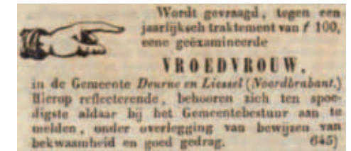
Op 26 november 1853 verscheen deze advertentie in de Noord-Brabantse.

schakelde men een baker in, die was niet duur. Een baker was een ongeschoolde kraamverzorgster. De naam baker komt van de term bakeren: na de bevalling werd de baby strak in doeken gewikkeld, waarbij de armpjes strak tegen het lijfje werden gedrukt.